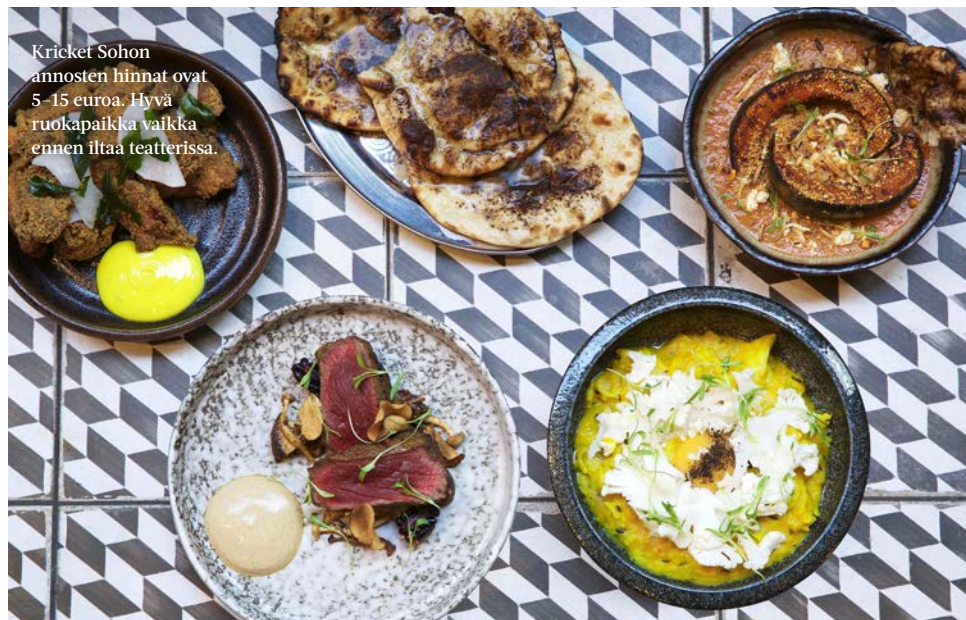
Kricket Sohon annosten hinnat ovat 5–15 euroa. Hyvä ruokapaikka vaikka ennen iltaa teatterissa.